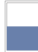
1/2 Seite quer 220x150 mm