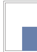
1/4 Seite hoch 107x150 mm