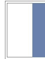
1/3 Seite hoch 76x310 mm