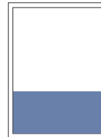
1/3 Seite quer 220x100 mm